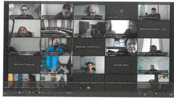
Sedința Comitetului Național al Zonei Costiere - 20230309 0733-1 #